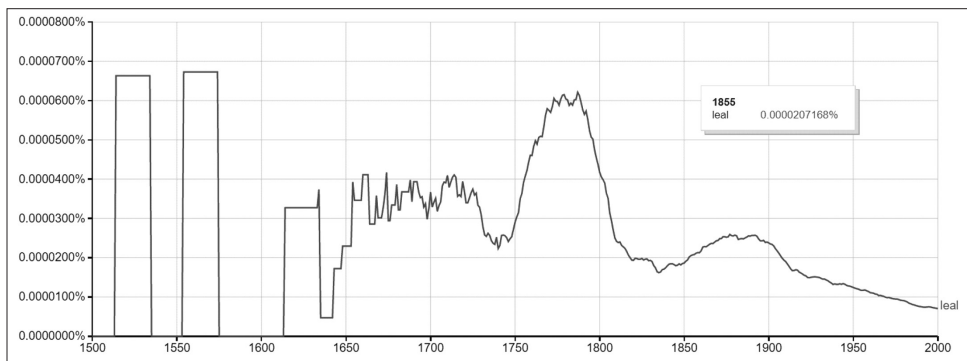
Графика 2. Честота на употребата на leal

За по-голяма яснота честотата на употребата на най-рядко използваното прилагателно leal е представена на отделна графика по-долу.