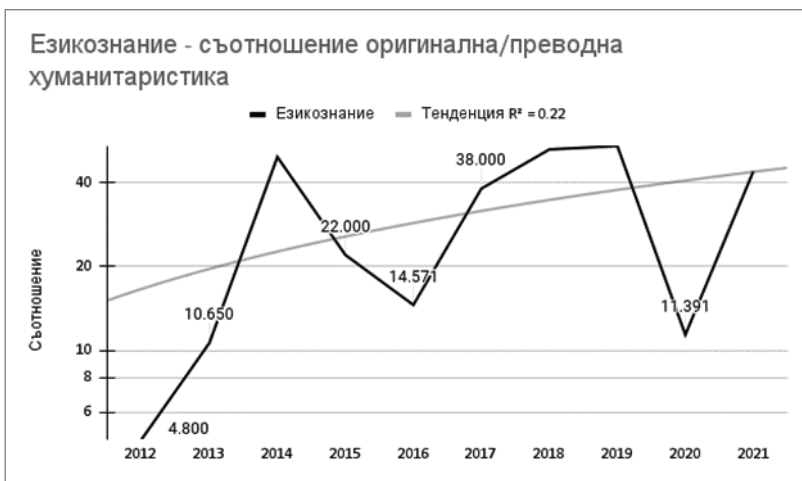
Диаграма 6. Категория езикознание – съотношение оригинална/преводна хуманитаристика