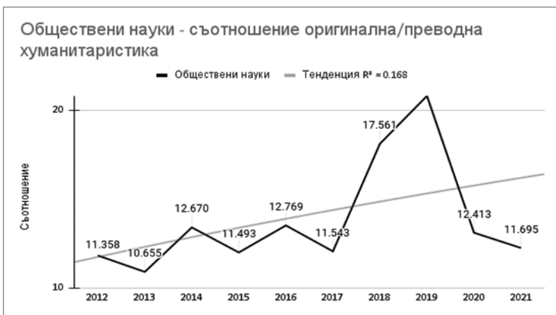
Диаграма 5. Категория обществени науки – съотношение оригинална/преводна хуманитаристика