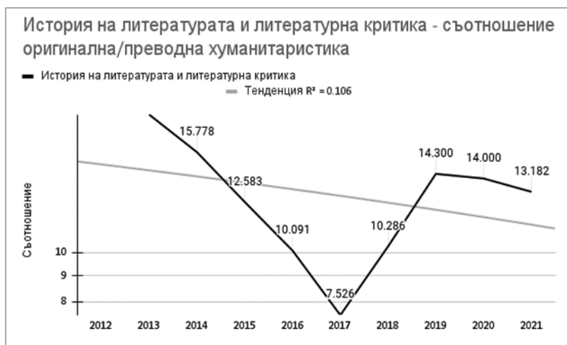
Диаграма 7. Категория история на литературата и литературна критика – съотношение оригинална/преводна хуманитаристика