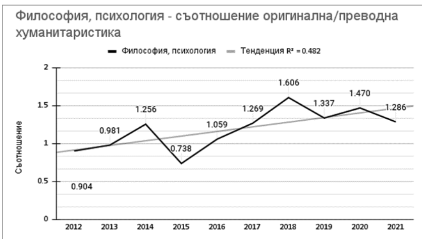
Диаграма 3. Категория философия, психология – съотношение оригинална/преводна хуманитаристика