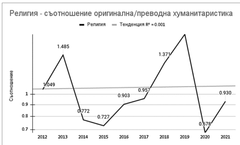
Диаграма 4. Категория религия – съотношение оригинална/преводна хуманитаристика