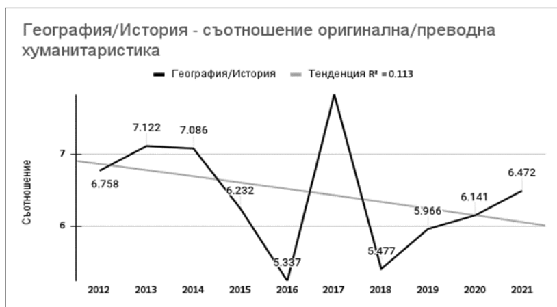
Диаграма 8. Категория география/история – съотношение оригинална/преводна хуманитаристика

Само в две от категориите – философия, психология и религия, се наблюдава съпоставим брой оригинални и преводни публикации, като през някои от годините дори преводните са повече от оригиналните (за философия и психология през 2012, 2013, 2015 г., за религия през 2014, 2015, 2016, 2017, 2020, 2021 г.). Съотношенията в останалите категории изглеждат обаче много по-различно. В областта на географията и историята съотношението е около 6:1 в полза на българските публикации. В голямата група на обществените