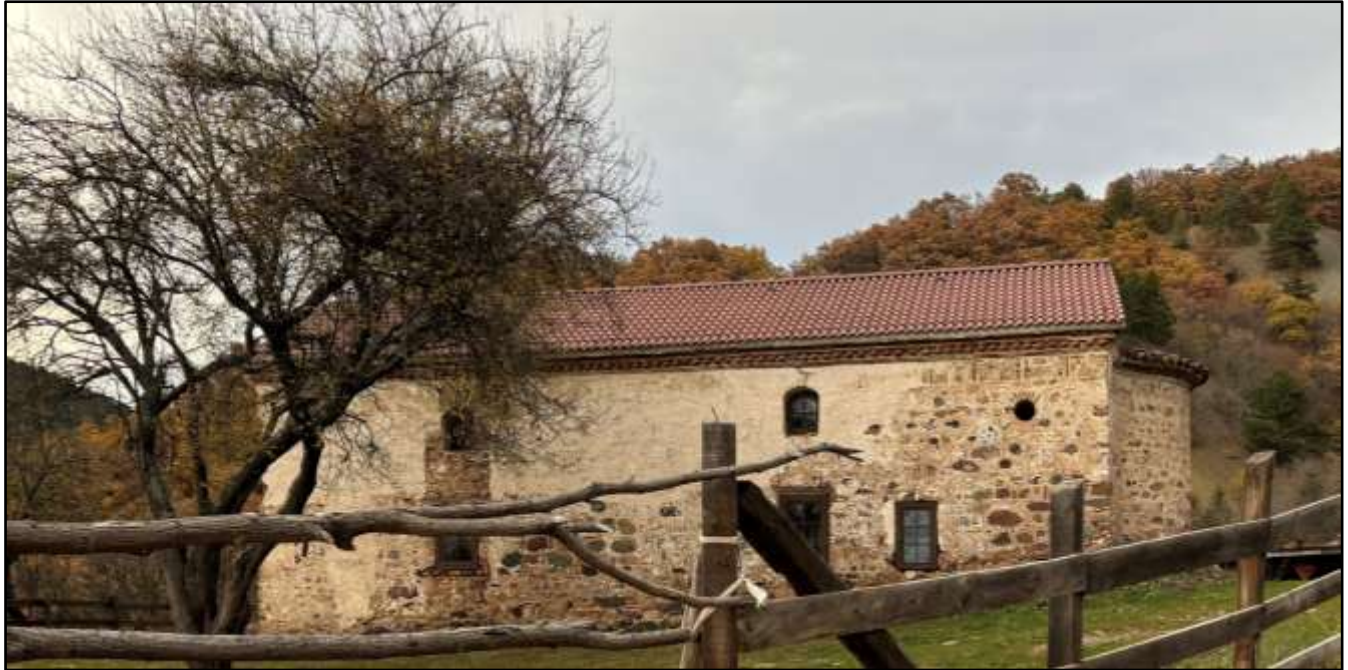
Фиг. 3. Градеж на манастирската църква. ноември 2024 г.