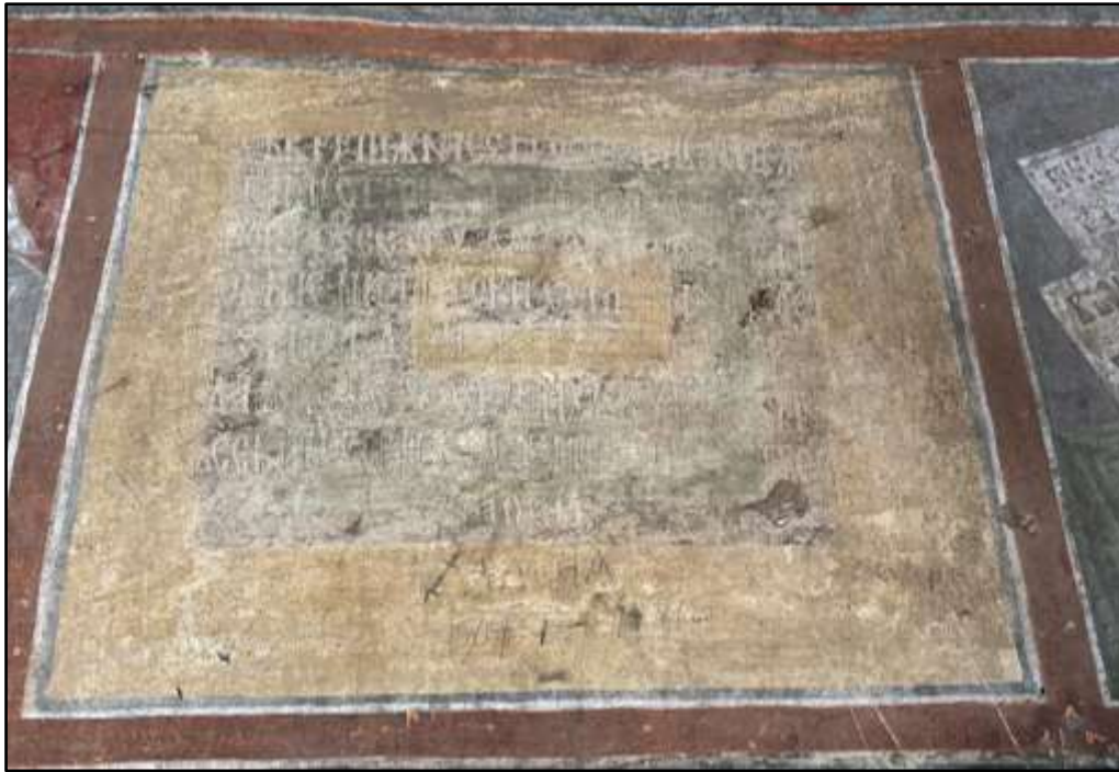
Фиг. 5. Ктиторски надпис, намиращ се на западната страна на наоса на църквата. Личен архив, март, 2025 г.