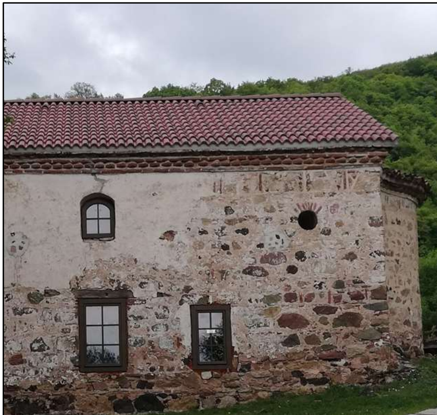
Фиг. 7. Ремонтираният покрив на сградата и сменената дограма. Личен архив, 2019 г.