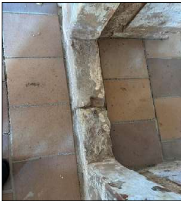
Фиг. 10. Плочките във вътрешността на храма. Личен архив, март, 2025 г.