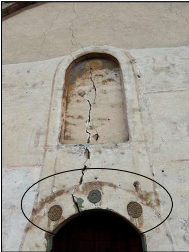
Фиг. 4. Орнаментална релефна украса върху западната врата на църквата. Ясно личат пукнатините върху фасадата на сградата. ноември, 2024 г.