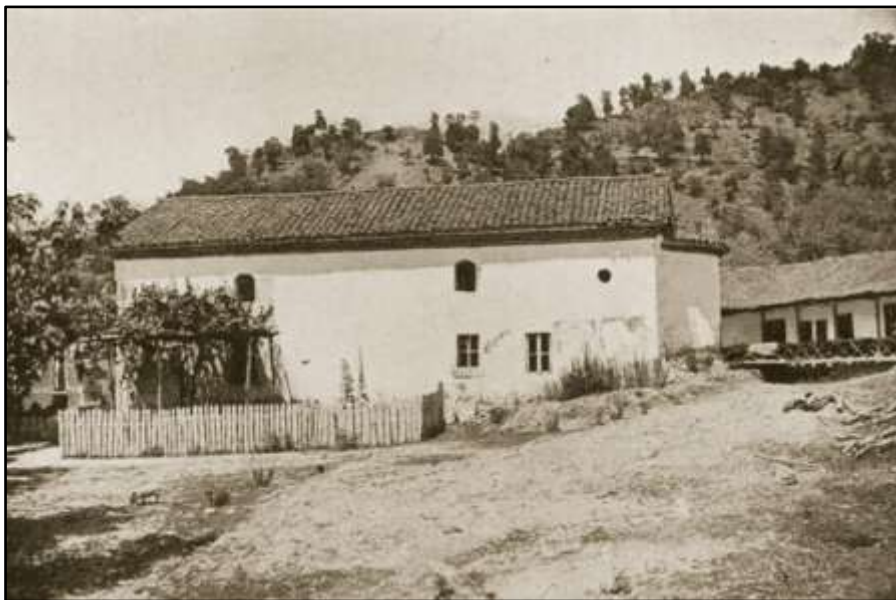
Фиг. 12. Манастирът през първата половина на XX в. (по П. Мутафчиев)

< https://www.bulgariamonasteries.com/seslavski_manastir/vatreshnostta_na_tsarkvata-2_175_3_big.html > [17 март 2025 г.]