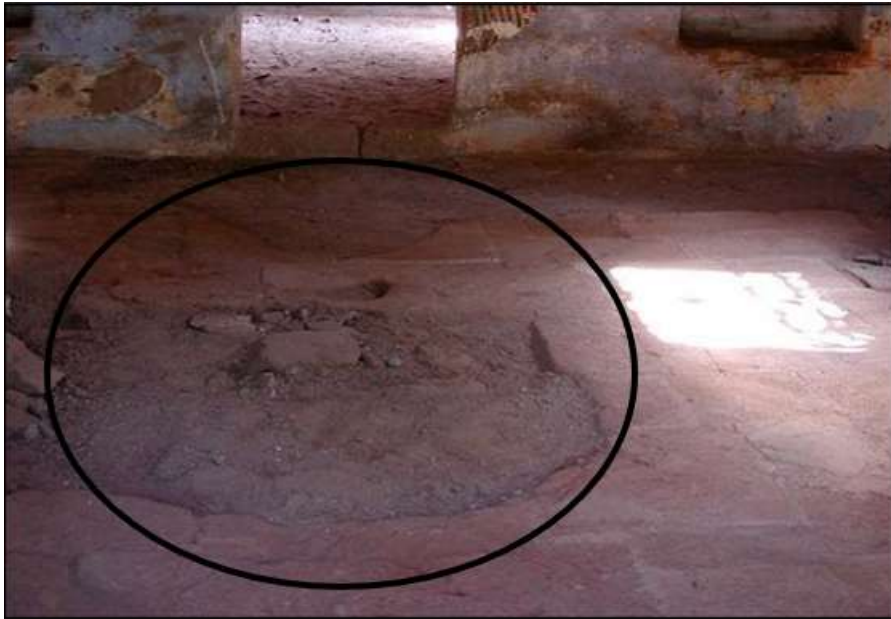
Фиг. 11. Иманярски изкоп в храма.

< https://www.bulgariamonasteries.com/seslavski_manastir/vatreshnostta_na_tsarkvata-2_175_3_big.html > [17 март 2025 г.]