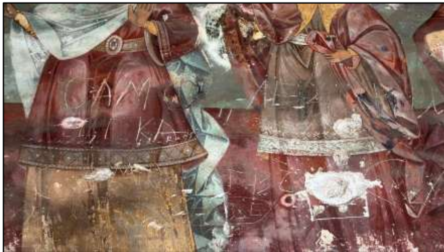
Фиг. 13. Нарушения върху стенописите.

< https://istorianasveta.eu/ct-menu-item-25/album/9-tzarkvi-i-manastiri-v-yuz-balgariya-ot-xv-xvii-v.html#media/9-tzarkvi-i-manastiri-v-yuz-balgariya-ot-xv-xvii-v/181-seslavski-manastir-sv-nikolai.html > [18 март 2025 г.]