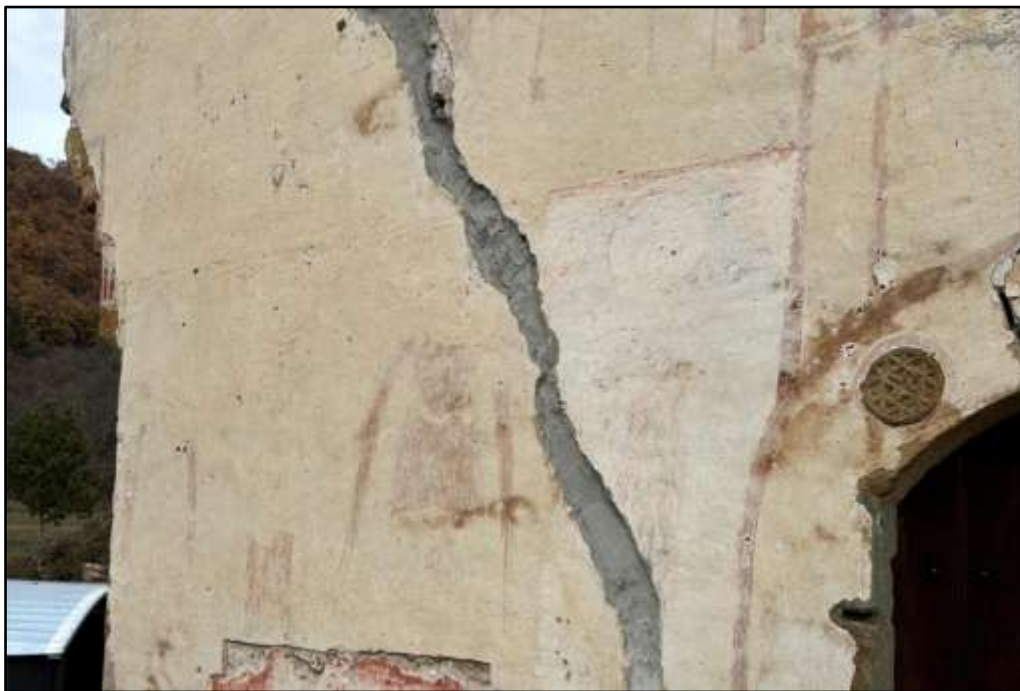
Фиг. 6. Повредени стенописи върху фасадата на църквата. Забелязва се запълването на пукнатината върху стената. Личен архив, март, 2025 г.