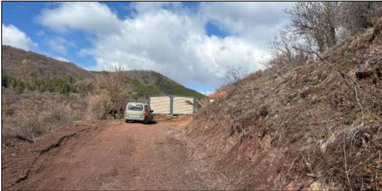
Фиг. 9. Дейности по облагородяване на района. Личен архив, март, 2025 г.