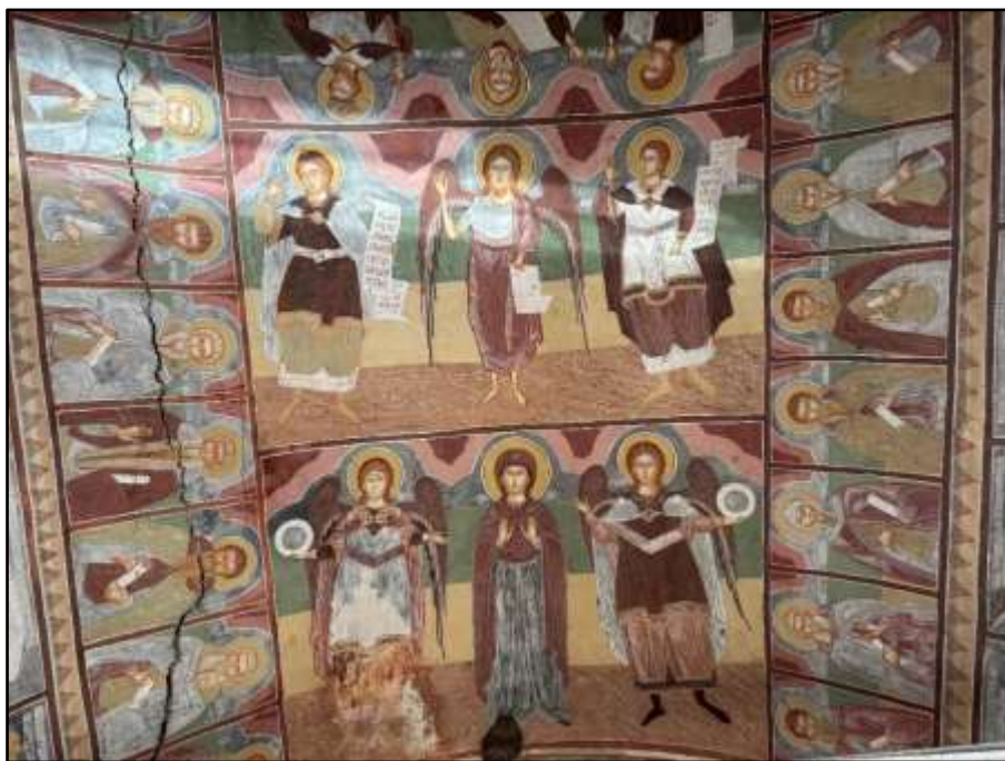
Фиг. 14. Добре запазени стенописи върху свода.