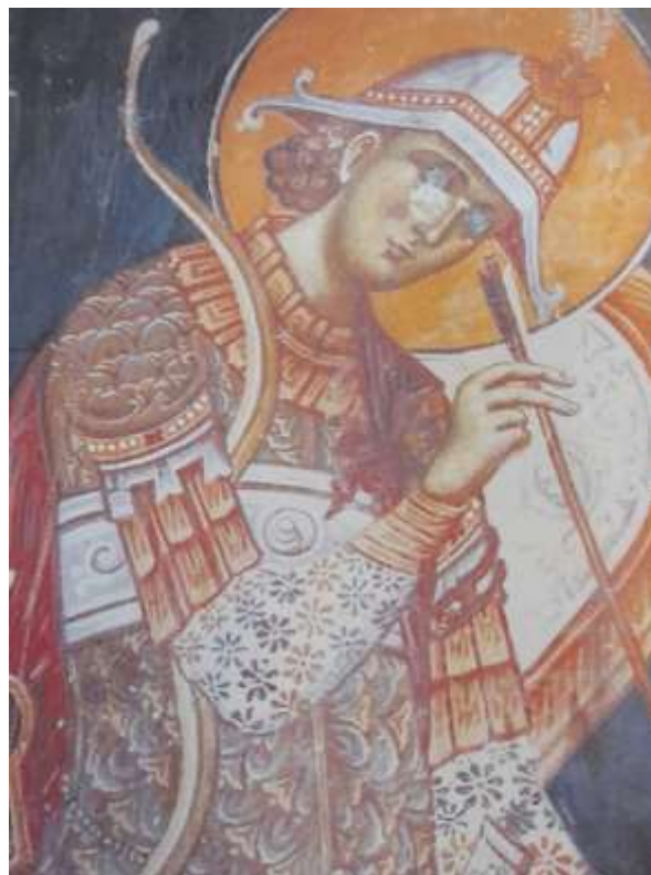
(изобр. 8) Стилизиран kettle helmet, Лондонско четвроевангелие (Иванов, 2019, стр. 8).

https://offnews.bg/kultura/zlatnoto-sakrovishte-ot-nag-sent-miklosh-v-balgaria-prez-april-646163.html .