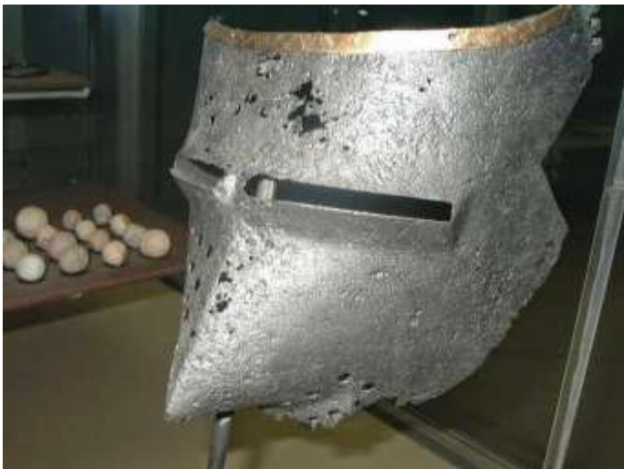
(изобр.15) Забрало тип "кучешки череп", Търновски музей (Николов, Захариев, 2014).