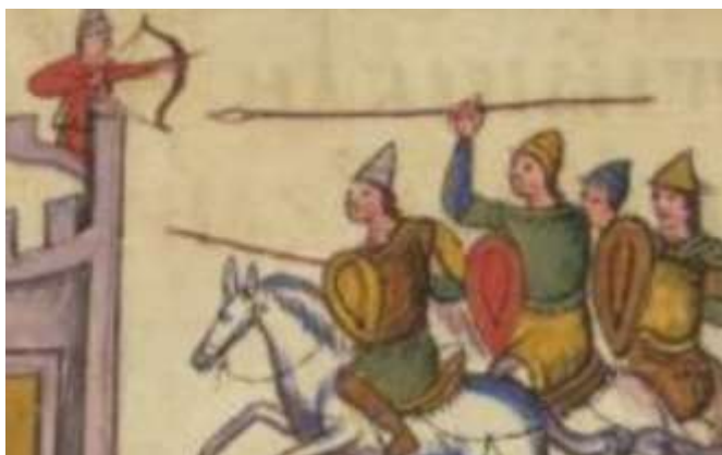
(изобр. 7) Български воин изобразен върху съд, съкровището от Наг Сент Миклош .

https://offnews.bg/kultura/zlatnoto-sakrovishte-ot-nag-sent-miklosh-v-balgaria-prez-april-646163.html .