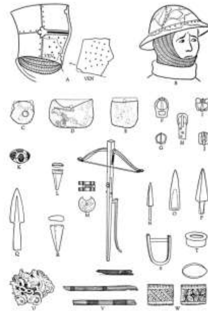
FIG. 15. ARMOR AND ARMS OF 1370, DRAWN FROM SPECIMENS FROM CHAMBER C OBJECTS ABOUT ONE THIRD NATURAL SIZE EXCEPT HELMETS (100% ARROWS) AND CROSSBOW (50% FULL)

https://en.wikipedia.org/wiki/Kettle_hat