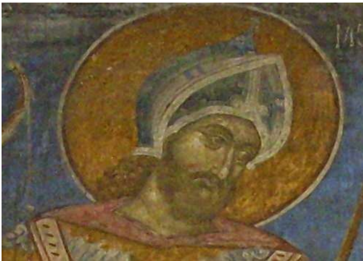
(изобр. 11) Базинет, намерен до Кюстендил (Николов, Захариев 2014).