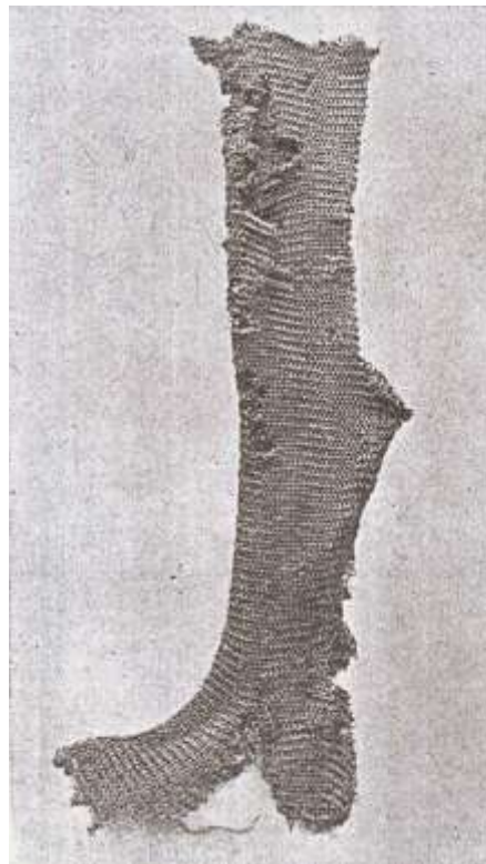
(изобр .18) Ковани защиты за крака, Марков манастир, Македонија (Николов, Захариев, 2014).