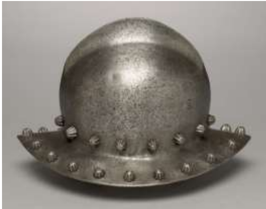
(изобр. 3) Шлем тип kettle helmet, XIV в.

https://en.wikipedia.org/wiki/Kettle_hat